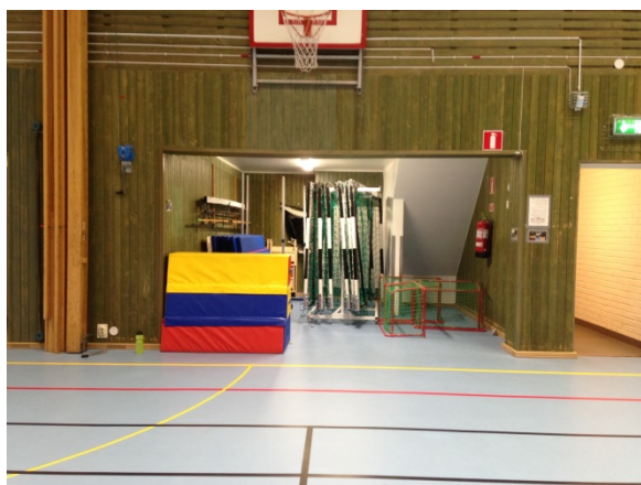
Figur 3 Exempel på förråd.

Någonstans i lokalerna ska det finnas plats för en hjärtstartare. Den ska vara lättillgänglig och skyltad men utan att vara i vägen för eller skadas av idrottsaktiviteterna.