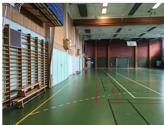
Figur 2 Exempel på hall.

Sportgolv, på sviktande undergolvskonstruktion, med målade linjer anpassade utifrån de idrotter som ska bedrivas i hallen. Linjefärg och mått enligt Måttbok – måttuppgifter för fritidsanläggningar – från Kompetenscentrum för Idrottsmiljöer.