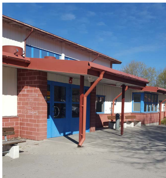
Figur 4 Entré med tak, Smedsgårdshallen

Entréer ska planeras i trafiksäkert läge. Om hallen är låst ska besökande kunna vänta både i väderskyddat och trafiksäkert läge på att bli insläppta.