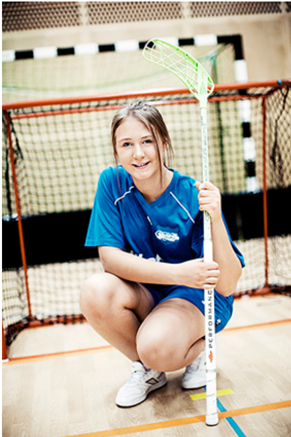
Figur 1

Detta funktionsprogram är framtaget av kommunens kultur- och fritidskontor i samarbete med fastighetsenheten på kontoret för samhällsbyggnad i syfte att tydliggöra kommunens krav på nya idrottslokaler.