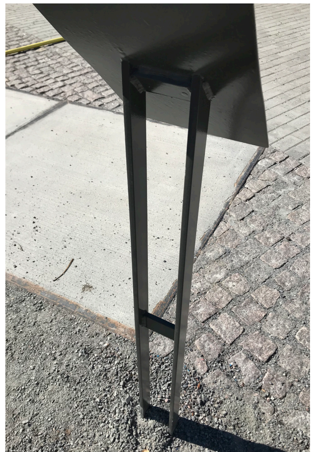
Bild på lekplatsskylten i Blå parken.