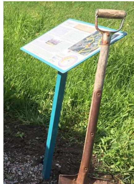
Bild på skylten när den är monterad.