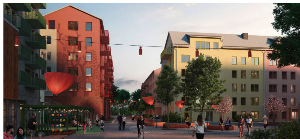
Vy från norr