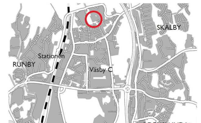
Orienteringskarta, planområdet markerat med röd ring.

Ange diarienummer KS/2019:37 i skrivelsen