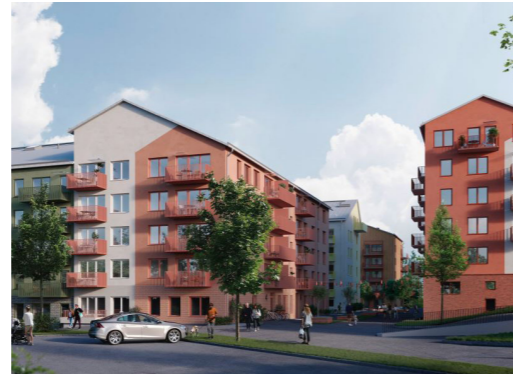
Vy från söder, från befintlig parkeringsplats

Förslaget är förenlig med kommunens översiktsplan.