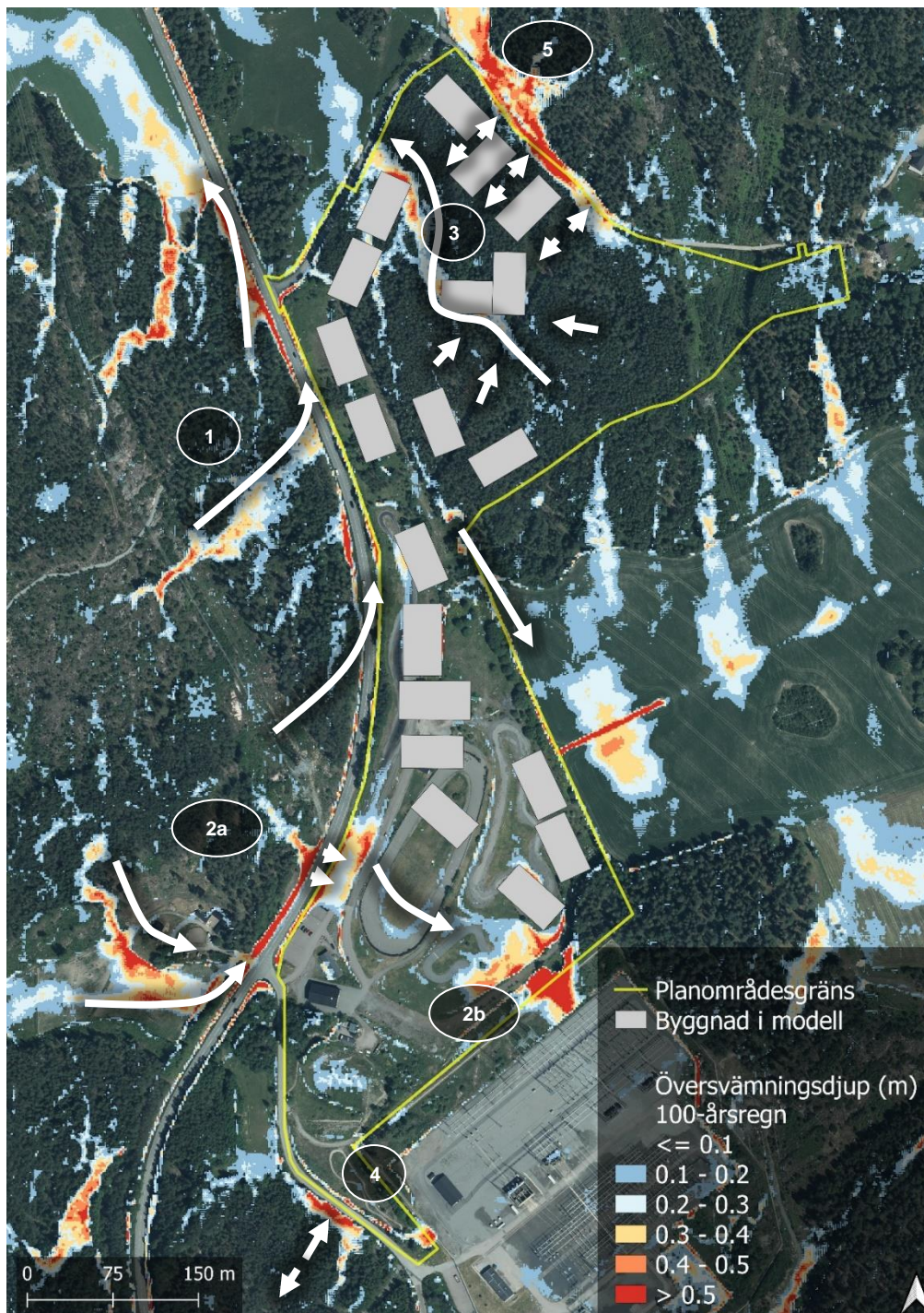
Figur 4. Maximalt översvämningsdjup vid 100-årsregn. Flödesriktningar illustreras av vita pilar och siffrorna 1-5 indikerar resultat som beskrivs i text ovan.

resultatet i bild. Vid detaljanalys av beräkningsresultatet framgår att vägen bör vara framkomlig i händelse av ett 100-årsregn.