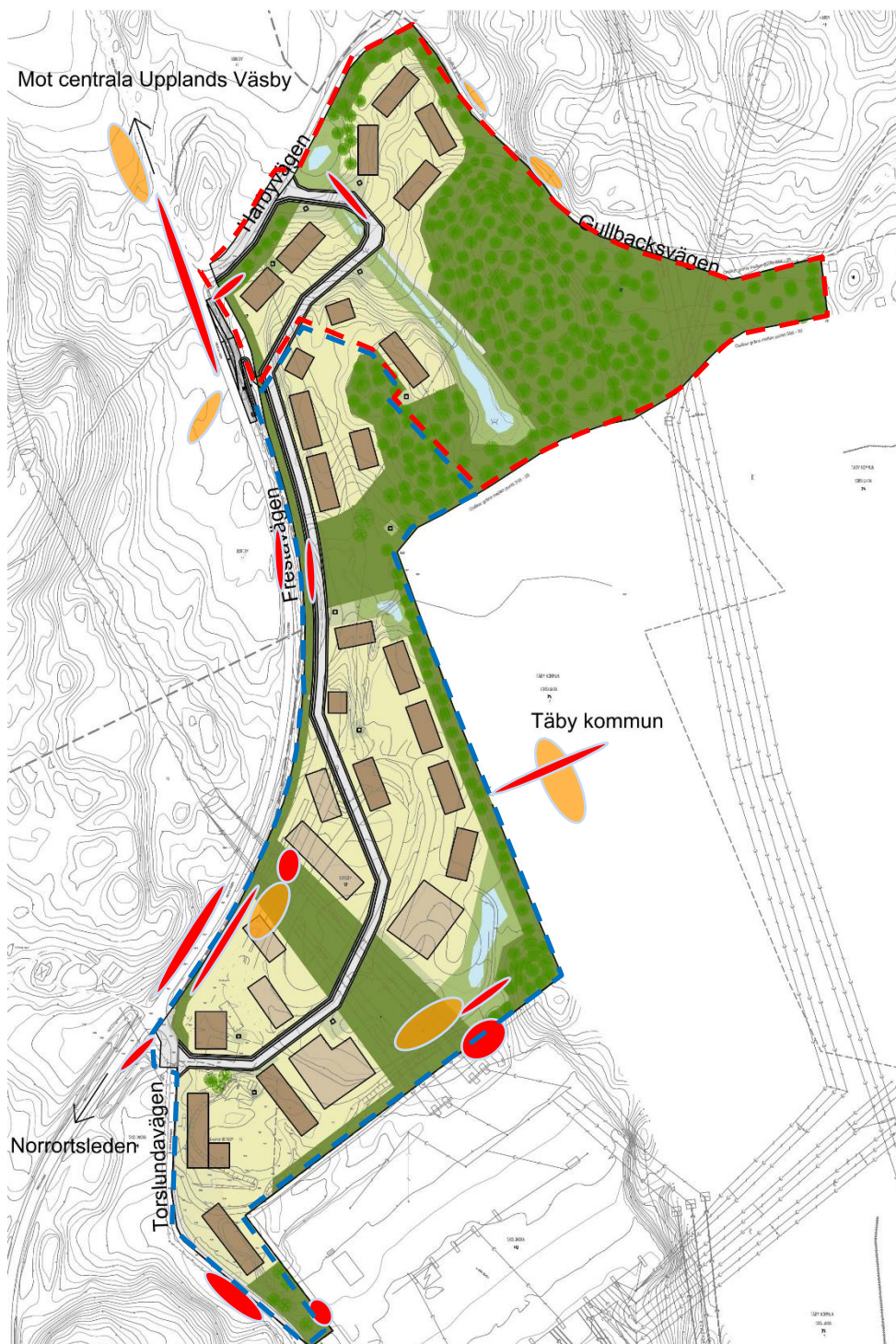
Figur 5. Maximalt översvämningsdjup vid 100-årsregn tolkat från Figur 4. Röd markering visar översvämningsdjup över 0,5 meter. Orange markering visar djup mellan 0,3-0,5 meter.