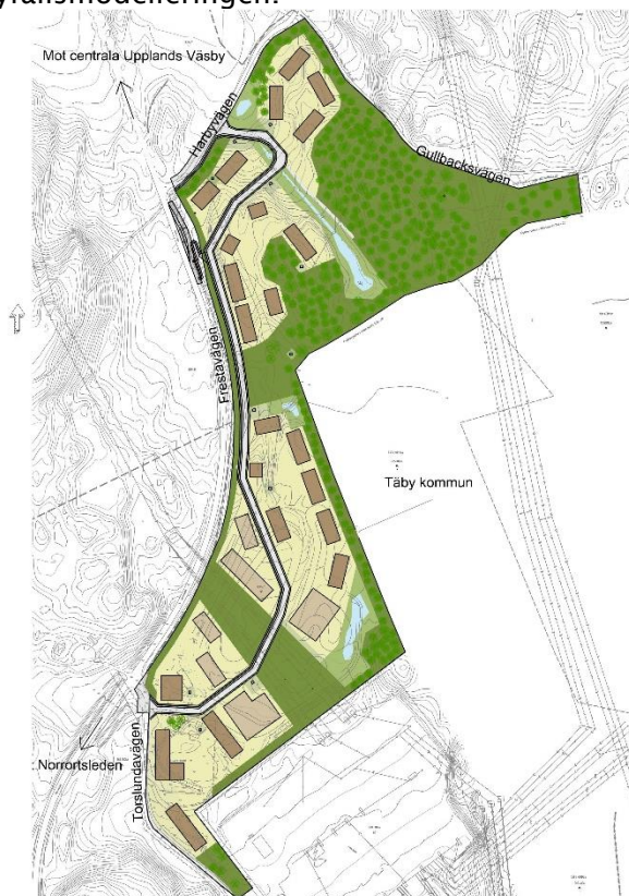
Figur 2. Illustrationskarta över området dat 220630 (Tyréns).

Den planerade bebyggelsens omfattning framgår ungefärligt av nedanstående illustration (Figur 2). I skyfallsmodellen har topografin justerats med avseende på tidigare föreslagna placering av byggnader från 2019, se Figur 1. Vid tillfället för skyfallsberäkningen befann sig planeringen av utredningsområdets utformning i ett tidigt skede. Byggnadernas placering i Figur 3 avviker därmed mot den senare framtagna illustrationsplanen. Avvikelserna bedöms inte påverka skyfallsmodelleringen.