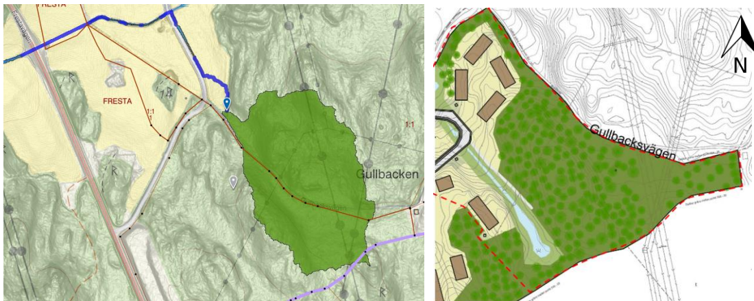
Figur 6. T.v. visas avrinningsområde markerat i grönt på ca 5 ha. Även den yttersta toppen avrinner i nuläget mot Gullbacksvägen T.h. visas utkast på illustration till plankarta med in zoomning på nordöstra området där detaljplanen kommer ange Naturmark.